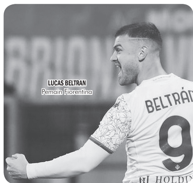
LUCAS BELTRAN Pemain Fiorentina

Musim ini, Beltran telah mencetak delapan gol dan satu asis dalam 33 penampilan di seluruh ajang. Fiorentina berada di urutan tujuh klasemen sementara dengan 41 poin dari 26 laga, dan mengincar tiket ke Liga Europa musim depan. ●vdp