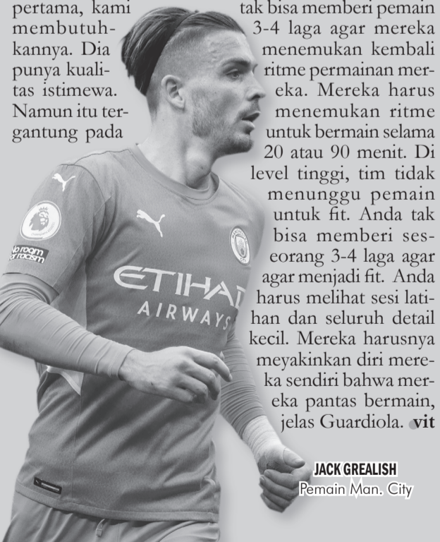
JACK GREALISH Pemain Man. City

Ia pun memberikan penjelasan terkait syarat yang dimintanya dari seorang pemain. “Saya tak bisa memberi pemain 3-4 laga agar mereka menemukan kembali ritme permainan mereka. Mereka harus menemukan ritme untuk bermain selama 20 atau 90 menit. Di level tinggi, tim tidak menunggu pemain untuk fit. Anda tak bisa memberi seseorang 3-4 laga agar menjadi fit. Anda harus melihat sesi latihan dan seluruh detail kecil. Mereka harusnya meyakinkan diri mereka pantas bermain, jelas Guardiola. ●vit