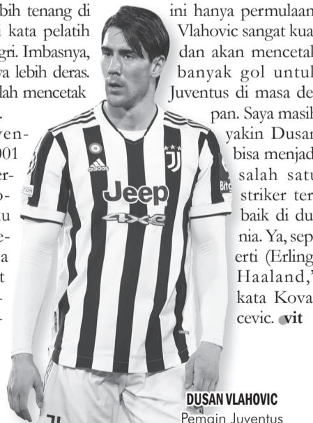
DUSAN VLAHOVIC Pemain Juventus