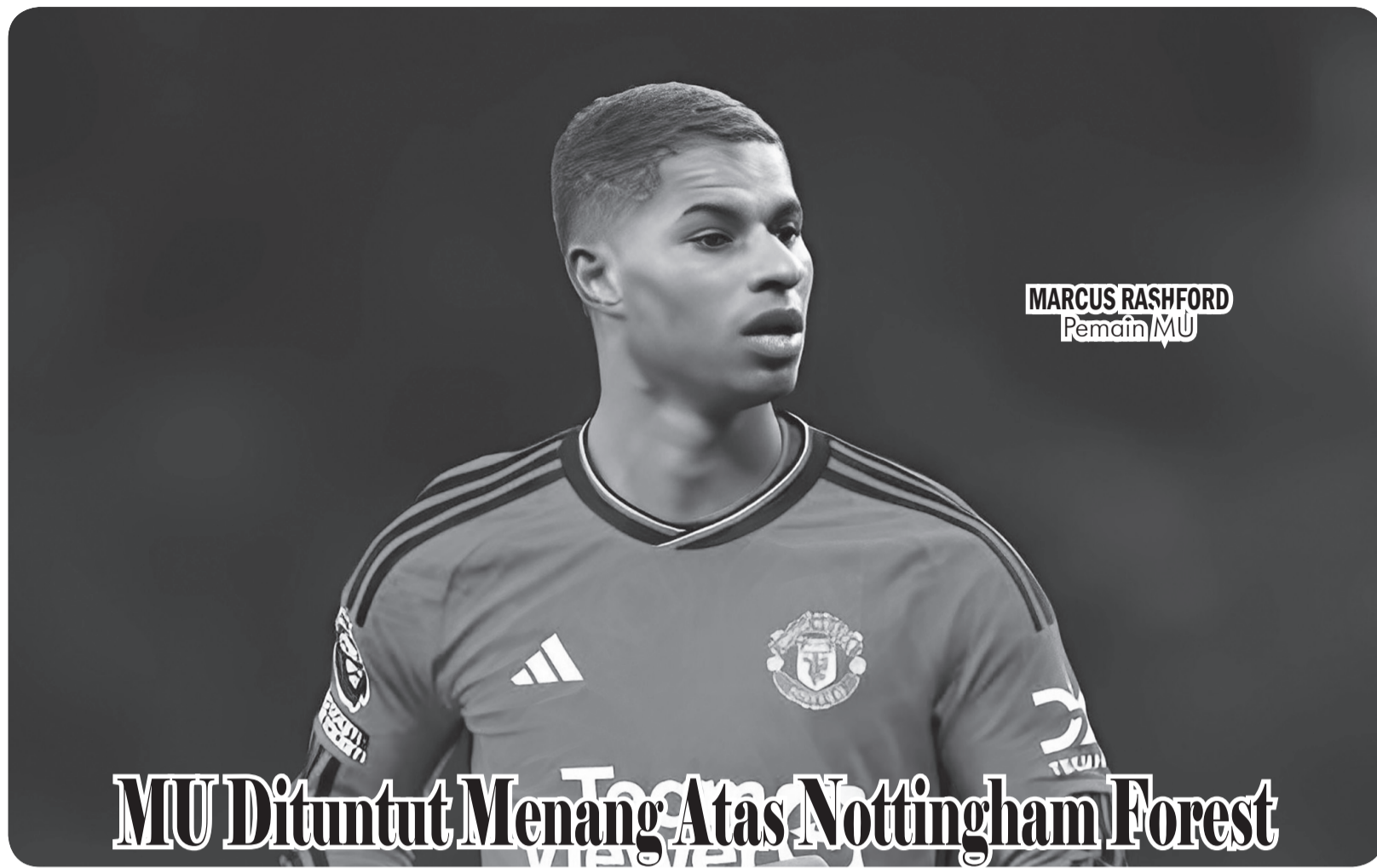
MARCUS RASHFORD Pemain MU