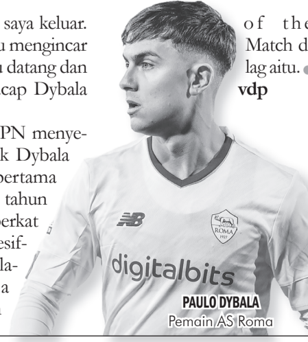
PAULO DYBALA Pemain AS Roma